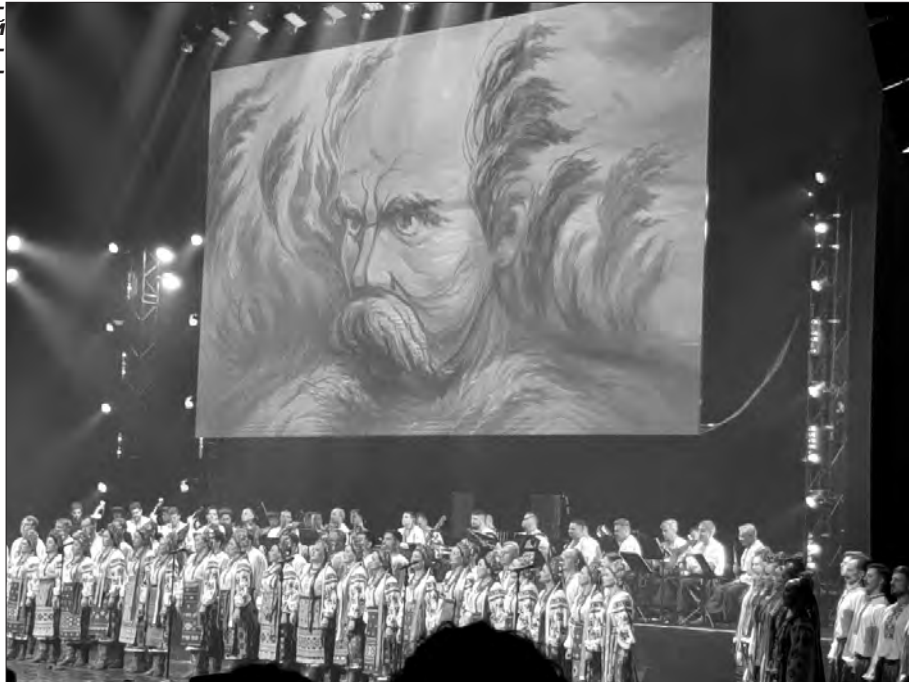
Під час концерту.

З Інтернету я також дізналася про ще один маловідомий факт. Кажуть, у жовтні 1959 року хор поїхав з гастролями до Мюнхена, а