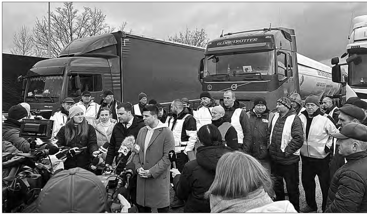
Увага до ситуації на кордоні неабияка.

Тим часом 25 листопада команда Міністерства розвитку громад, територій та інфраструктури спільно з Асоціацією міжнародних автомобільних перевізників роздали 2500 тисячі